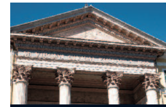
Il Duomo di Cuneo.