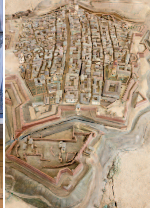
SOPRA E SOTTO Balconi e vetrine in via Roma. IN ALTO A DESTRA Plastico di Cuneo all'inizio del XVIII secolo.