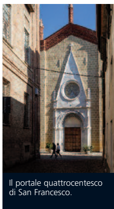
Il portale quattrocentesco di San Francesco.