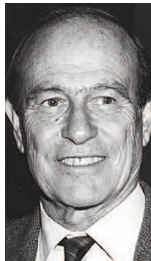
Lalla Romano, IN UN SOGNO NEL NORD

“ ... la Cuneo in cui sono nato e cresciuto e che mi ha profondamente segnato era per cominciare una città castrense, militare, con strade ortogonali, con una topografia chiara, precisa... Il mio vero, ultimo, esistenziale incontro con Cuneo fu un incontro a distanza durante la guerra partigiana, pochi giorni prima della liberazione. Ero in valle Grana e tornai al monte Tamone... si vedeva Cuneo, proprio come nella stampa antica che tengo nel mio studio. Una Cuneo che nel tramonto sembrava ancora circondata da baluardi, da fossati, con la bandiera azzurra dei Savoia issata sul palazzo del governatore dove una notte dormii anche re Enrico di Francia. La Cuneo delle strade ortogonali, delle gerarchie ferme, dei convincimenti immutabili entrata dentro di me con i succhi della terra e la memoria delle pietre, con le certezze di mia madre che i nostri fossero i migliori alimenti, le migliori piazze e strade, la migliore aria del mondo. La Cuneo di cui capii la modesta ma enorme forza nel resistere... Cuneo, città della forza ordinata ☺☺